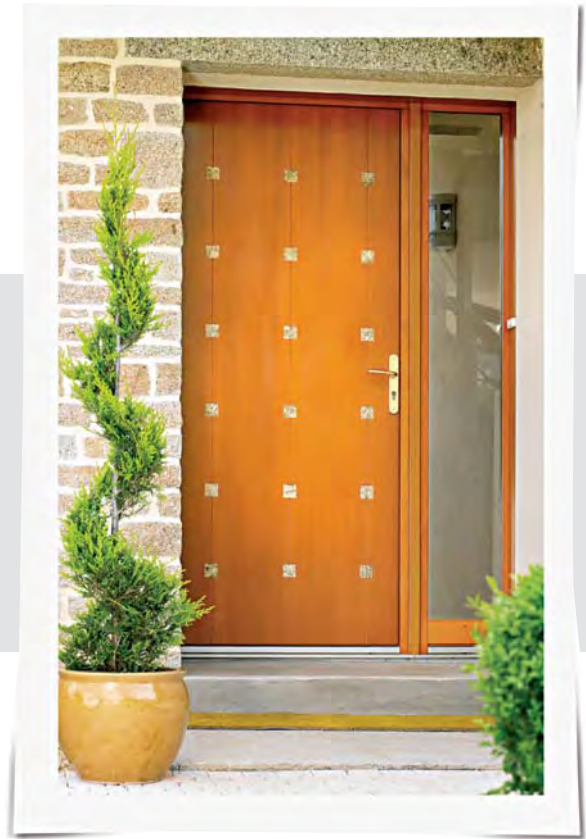
THÉORÈME + FIXE VARIATION MODULAIRE