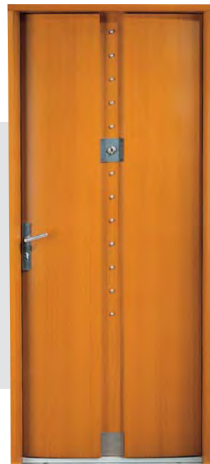
ELLIPSE Moabi 2150 x 900