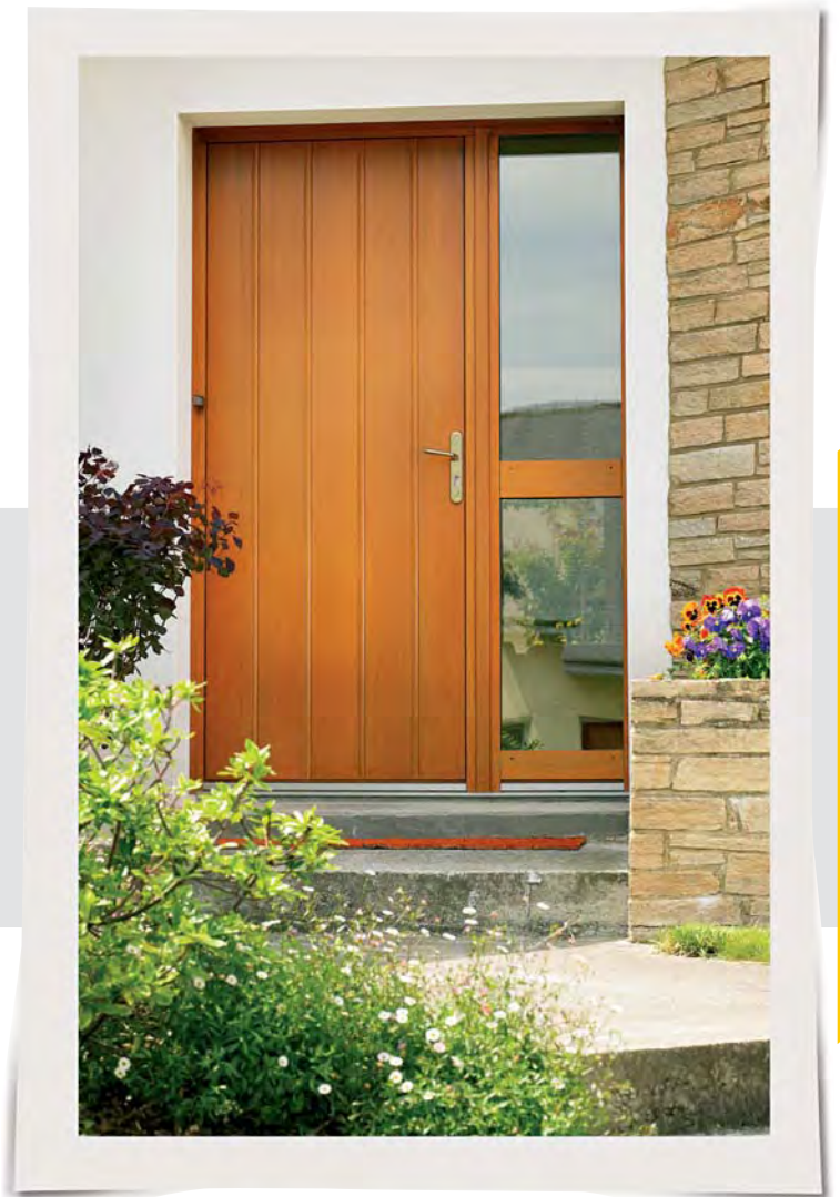
INTÉGRALE + FIXE VARIATION MODULAIRE