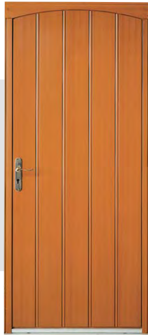
INTÉGRALE Moabi 2150 x 800/900 traverse cintrée