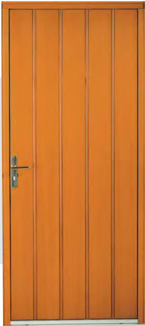
INTÉGRALE Moabi 2150 x 800/900 2150 x 1300/1400