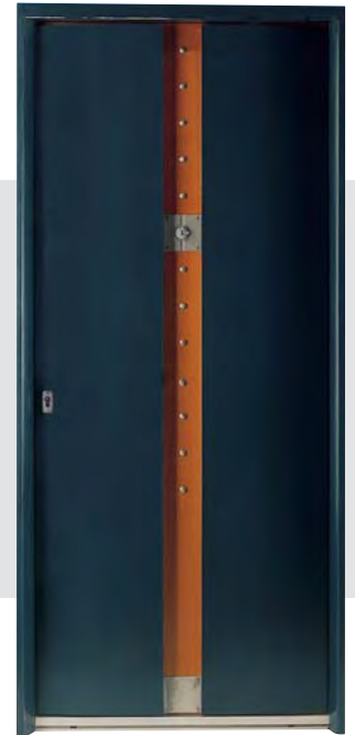
ELLIPSE Ex : Moabi laqué Bleu 5013 face extérieure option: ouverture à clé