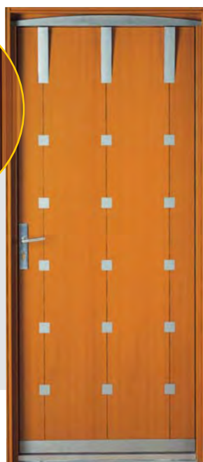
AXIOME Moabi 2150 x 900 2150 x 1300/1400