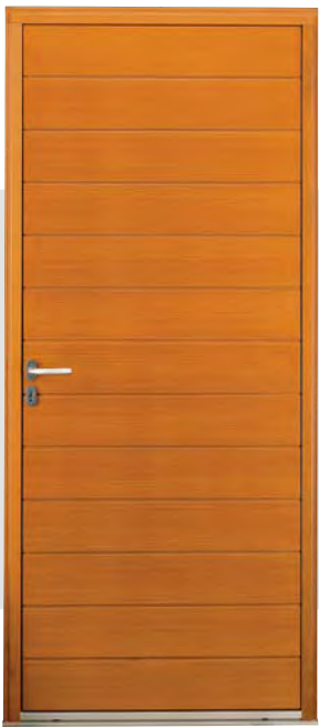
FRACTION Moabi/Chêne 2150 x 900/1000 2150 x 1300/1400