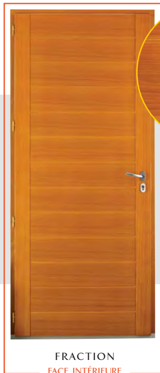
FRACTION FACE INTÉRIEURE