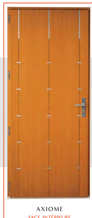
AXIOME FACE INTÉRIEURE

Les portes rectangulaires peuvent se faire en deux vantaux égaux 1600 et 1800 en fonction du vantail de base existant. Les dimensions 1200/1300/1400 portées sous un modèle indiquent l'existence de solutions semi-fixes identiques au modèle présenté.