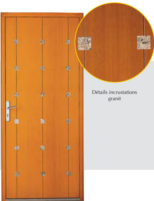
Détails incrustations granit