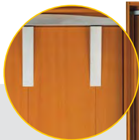
Détail incrustations acier inox

Avec des matières nobles, ils ont reproduit le passé, le présent et le futur dans nos portes d'entrée Intemporelles® .