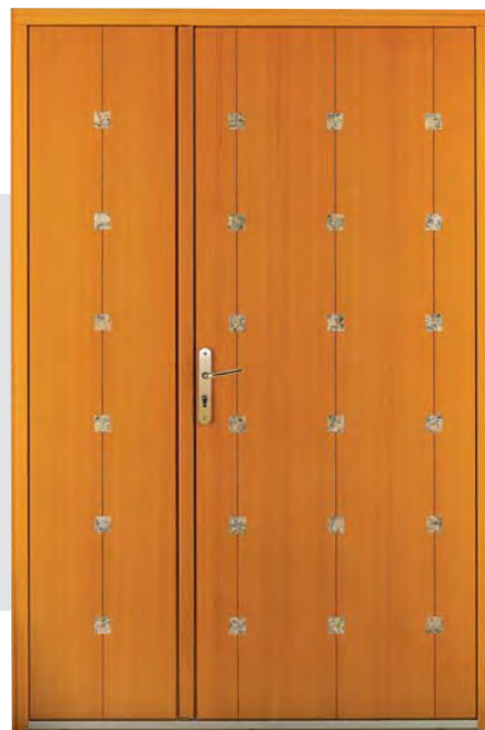
THÉORÈME + SEMI-FIXE